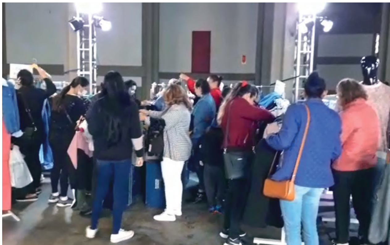
Na oportunidade foram comercializados peças masculinas, femininas, infantil, moda fitness, plus size, entre outras

“Ficamos muito felizes com o resultado desse bazar, pois tivemos um bom retorno. Muitas peças foram comercializadas e as empresas par-