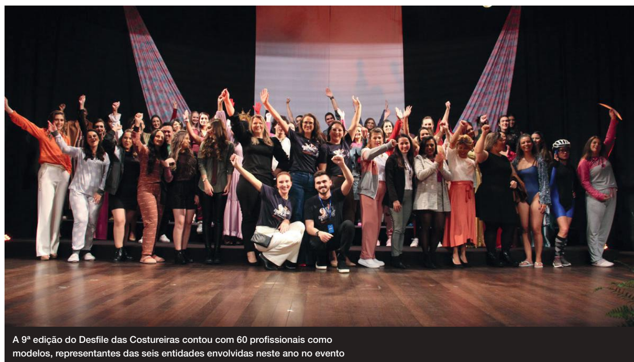
A 9ª edição do Desfile das Costureiras contou com 60 profissionais como modelos, representantes das seis entidades envolvidas neste ano no evento