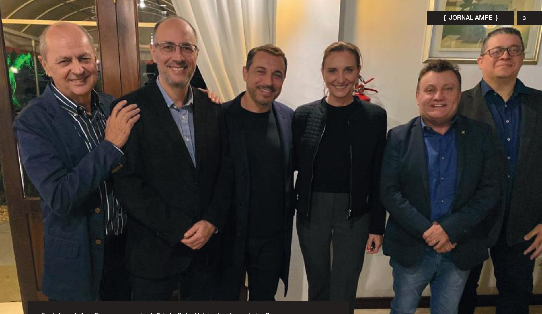
Os diretores da AmpeBr com o governador do Estado, Carlos Moisés, durante sua vinda a Brusque